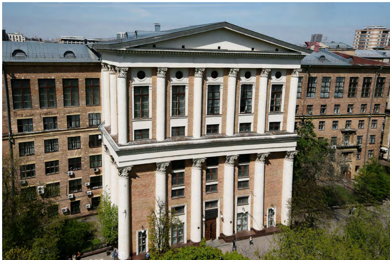
Центральный вход в здание РГГУ с улицы Чайнова, дом 15, г. Москва