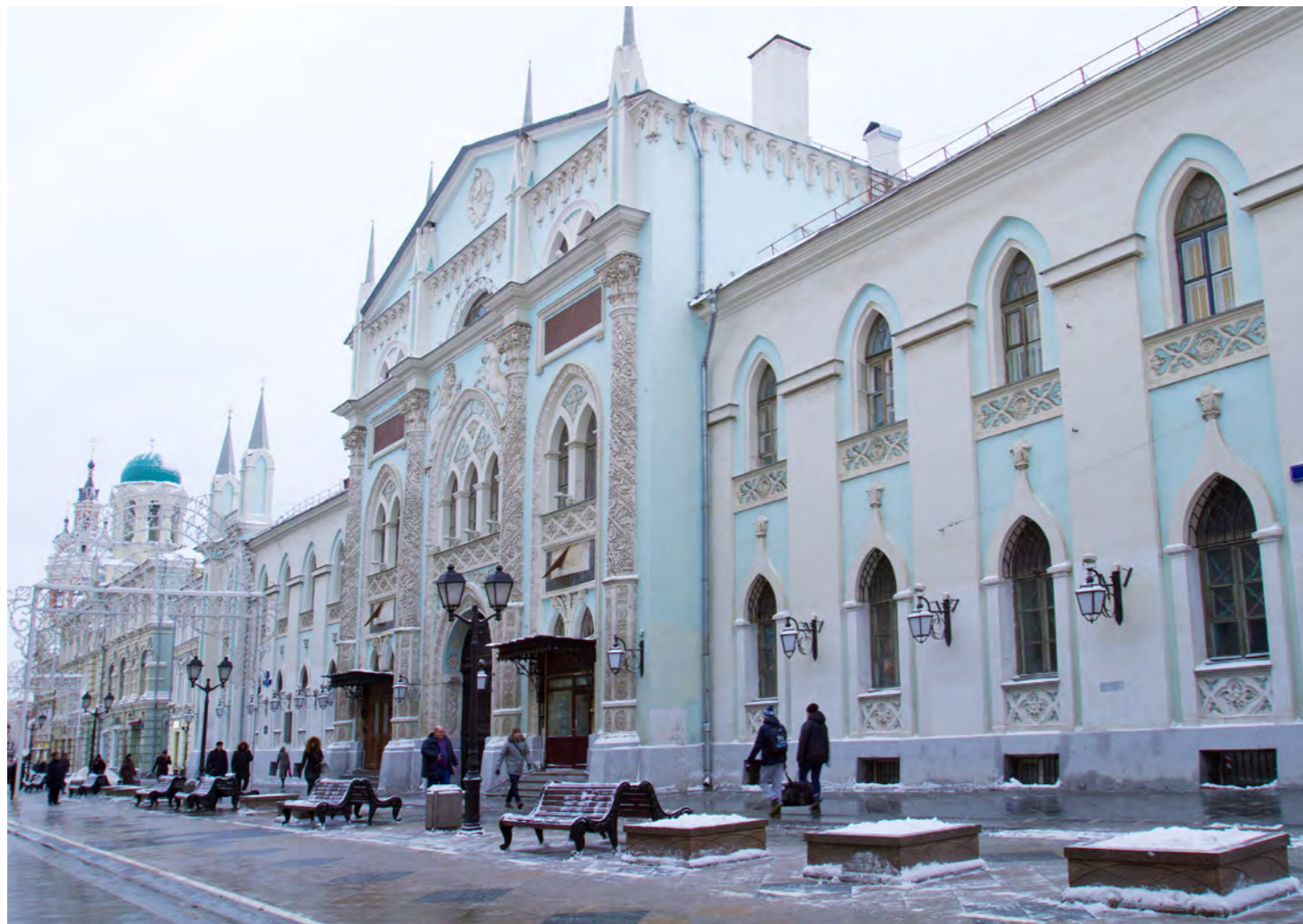
Фасад здания Историко-архивного института Российского государственного гуманитарного университета, расположенного в самом центре Москвы, между Лубянской и Красной площадью