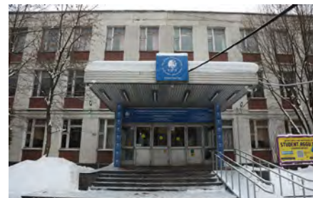
Кампус РГГУ на Кировоградской улице RSUH campus, Kirovogradskaya Street